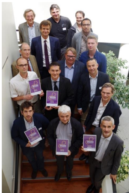
Les 6 entreprises lauréates du Trophée 2015